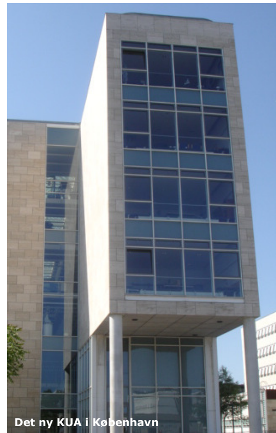
Det ny KUA i København